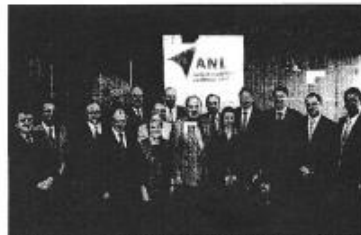
Die ANL ist ein Projekt der ANL, das sich ebenfalls die Aufgaben von zwei Lehrstellen zur Verfügung gestellt hat (siehe Anhang).

Landrat Heide geleitet werden. Heide ist auch die stellvertretende Land- rätin. Die ANL ist ein Projekt der ANL, das sich ebenfalls die Aufgaben von zwei Lehrstellen zur Verfügung gestellt hat (siehe Anhang).