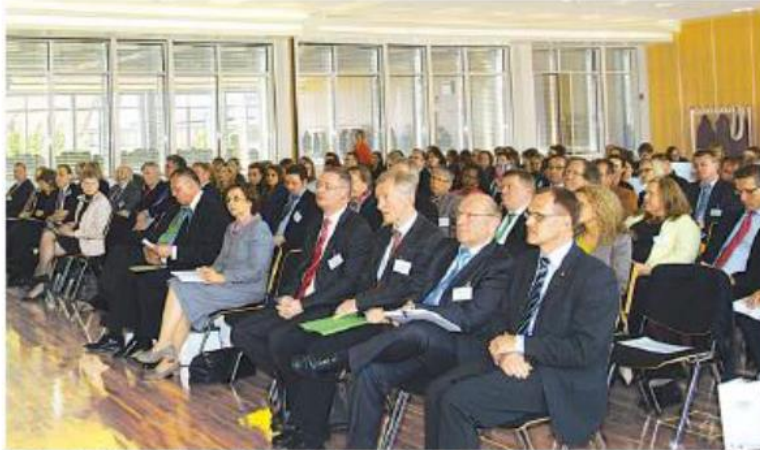
Kongresseröffnung am 5. Mai 2014 in der IHK-Akademie Mittelfranken

Der Nürnberger Ausbildungsring Ausländischer Unternehmer e.V. (AAU) feierte sein 15-jähriges Bestehen mit dem Kongress "MITeinander Zukunft gestalten" am 5. und 6. Mai in Nürnberg. Den Kongress hat Bayerns Arbeits- und Sozialministerin Emilia Müller eröffnet.