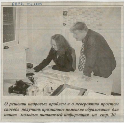
О решении кадровых проблем и о невероятно простом способе получить признанное немецкое образование для наших молодых читатель информации на стр. 20

„Bilanz kann sich sehen lassen“ Die AAK versucht die Mitarbeiter, die Potenzial an Ausbildungsstellen bei ausländischen Unternehmern zu erschließen. Dazu: Zwei wachst die Zahl der selbstständigen Unternehmer mit ausländischen Firmenpartnern. Das liegt laut Rainer Abschn von AAK daran, dass viele nicht wissen, wie das dual Ausbildungssystem funktioniert. Genau da setzt die Hilfe an. Außerdem will der Verein ausländische Jugendliche, die schon mehrmals bei der Bewerbung ab-