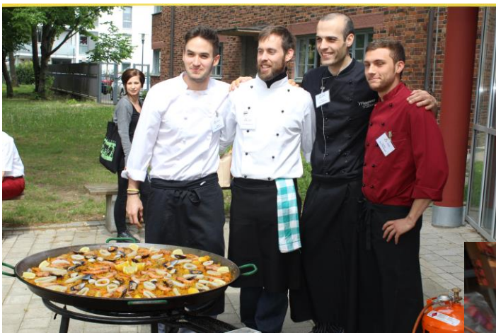
Die spanischen Koch-Azubis des AAU e.V.