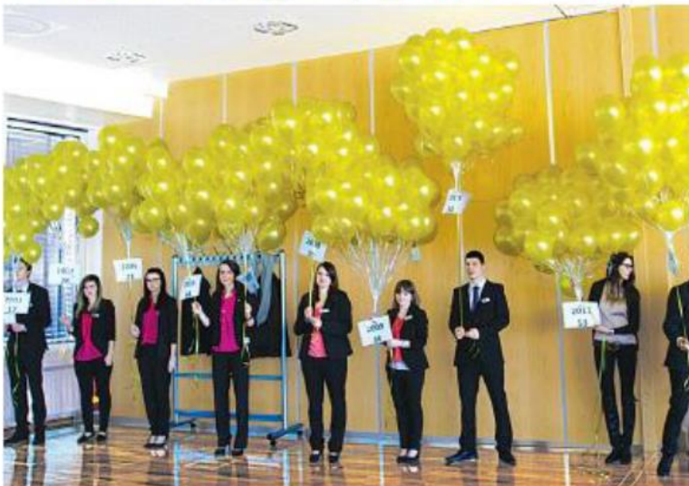
Bei Kongresseröffnung in der IHK-Akademie Mittelfranken

Bei der zweitägigen Veranstaltung, die in der IHK-Akademie Mittelfranken in der Walter-Braun-Straße und im Klee-Center in der Kleestraße stattfand, wurden erprobte Modelle der beruflichen Integration vorgestellt. 170 Bildungsexperten aus dem gesamten Bundesgebiet haben an der Veranstaltung teilgenommen. Bei Fachvorträgen und Workshops haben sie die Themen Migrationspolitik, Fördermöglichkeiten für Integrationsprojekte, stärkere Einbindung der Eltern, Ausbildung bei Unternehmen mit Migrationshintergrund sowie bessere berufliche Orientierung von Migranten "MITeinander" diskutieren.