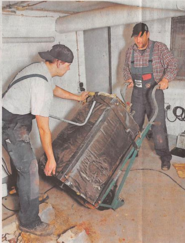
Handwerker braucht das Land, forderten Bildungspolitiker und Kammer-Chefs in Nürnberg. Im Bild wird ein alter Heizkessel ausgetauscht.

Erschwerend komme hinzu, dass manch ein Geschäftsführer oder